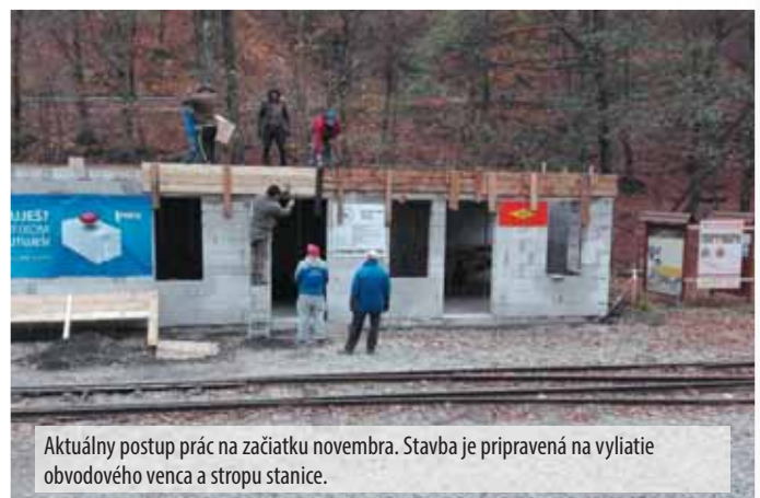
Aktuálny postup prác na začiatku novembra. Stavba je pripravená na vylitíe obvodového venca a stropu stanice.

Košická detská historická železnica v minulosti disponovala tromi staničnými budovami. Od budúcej sezóny sa návštevníci azda budú môcť tešiť z prvej novučičkej stanice na našej čermeľskej železnici.