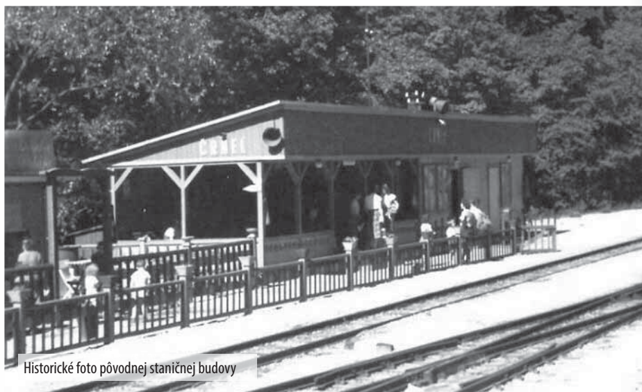
Historické foto pôvodnej staničnej budovy