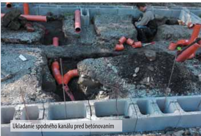
Ukladanie spodného kanálu pred betónovaním

Nová staničná budova ponúkne nie len dostatočné prevádzkové zázemie pre dobrovoľníkov detskej železnice a pracovné prostredie pre ich vedúcich, dôstojné priestory získava napríklad samotný predaj lístkov, ces-