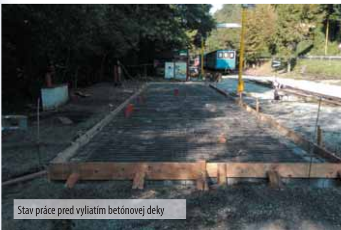
Stav práce pred vylitím betónovej deky

Peniažkov na stavbu tohto rozsahu samozrejme nie je nikdy dosť, aj keď občianske združenie získalo na výstavbu časť financií z projektov Nadácie VÚB či