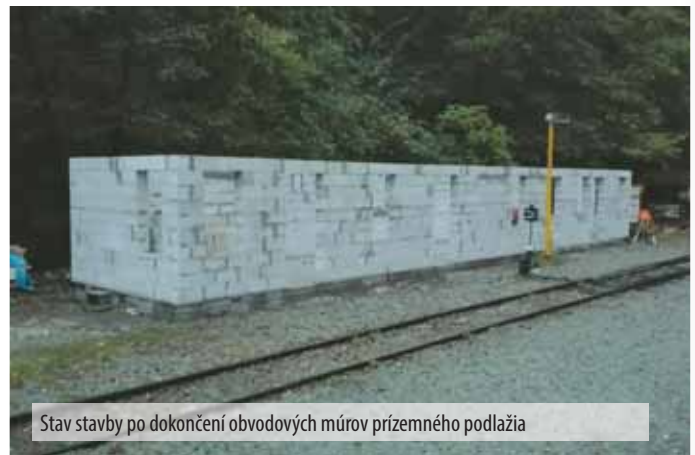
Stav stavby po dokončení obvodových múrov prízemného podlažia

Ochota pomôcť medzi stavebnými firmami už našla svoju odozvu. Veľkú pomoc pri stavbe napríklad poskytl spoločnosť ISK (Inžinierske stavby, a. s.), ktoré na stavbu bezplatne dodali materiál na betónovanie a aj inú pomoc.