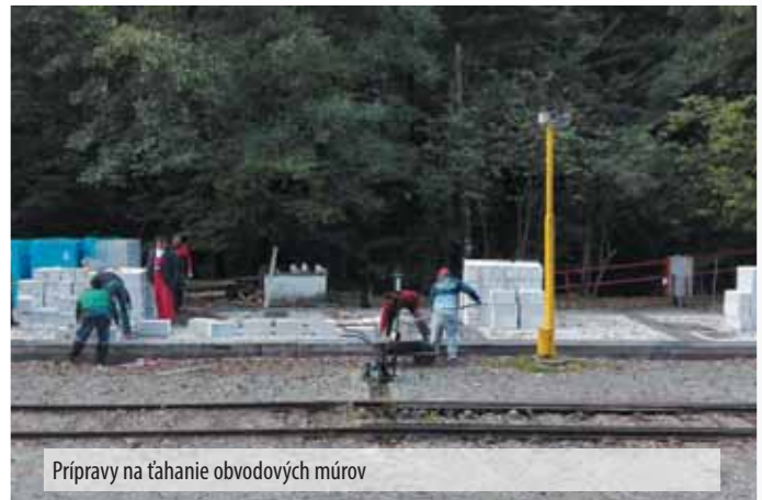
Prípravy na ťahanie obvodových múrov